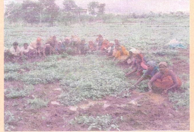
धान की खेती