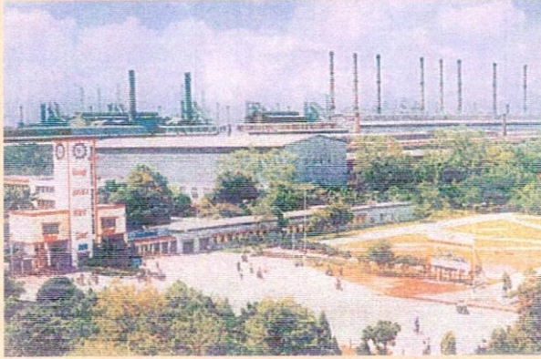
भिलाई इस्पात संयंत्र